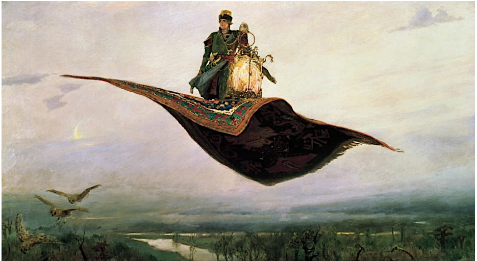
The Flying Carpet, Painting by Viktor Vasnetsov